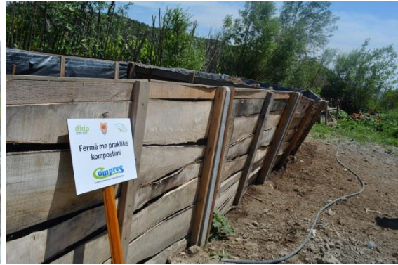
Foto 4 Kompostimi në Dajç, Qershor 2015