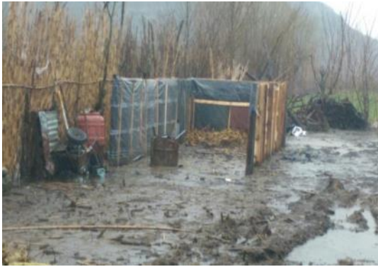
Foto 3 Kompostimi në Dajç, Shkurt 2015